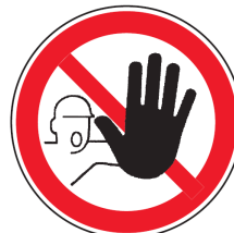
P06 „Zutritt für Unbefugte verboten“