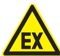
W21 „Warnung vor explosionsfähiger Atmosphäre“

Folgende Hinweisschilder nach BGV A 8 [2] sind vor Aufnahme der Tätigkeiten aufzustellen bzw. anzubringen: