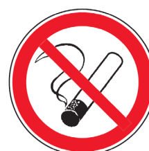
P01 „Rauchen verboten“