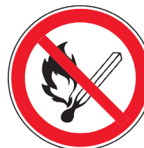
P02 „Feuer, offenes Licht und Rauchen verboten“